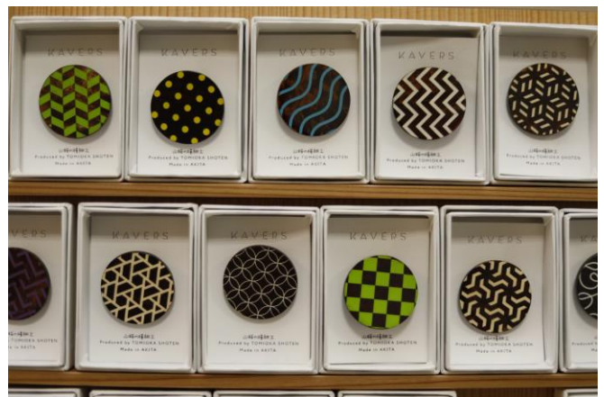
縦にディスプレイされるのは「小」サイズのブローチだ。