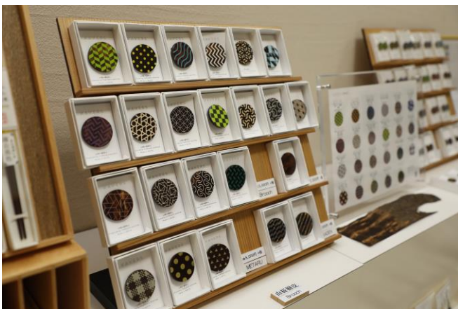
ショップに並ぶKAVERSブローチ。